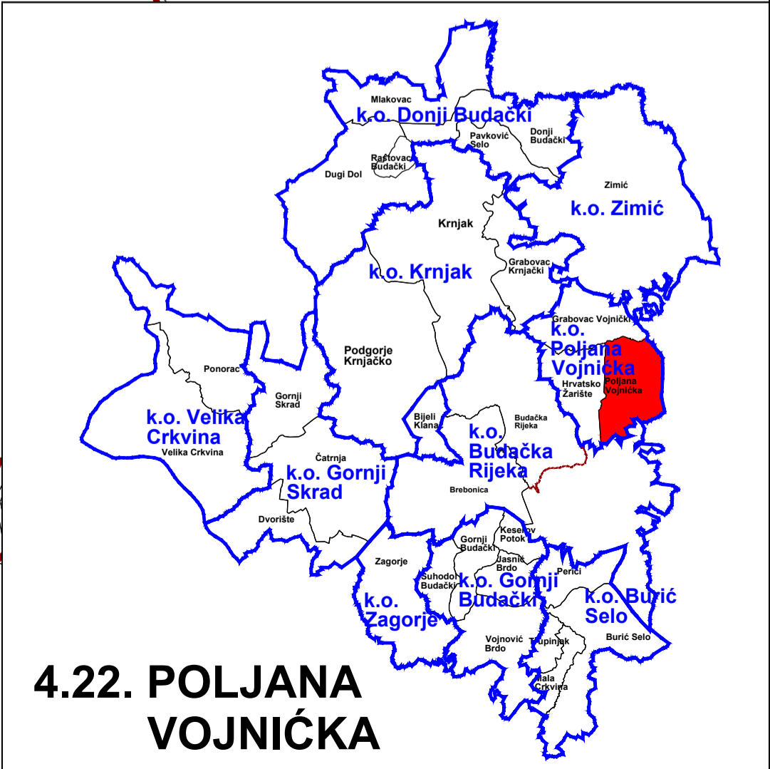
4.22. POLJANA VOJNIČKA